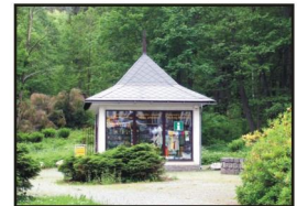
Turistické informační centrum Karlova Studánka

Agentura Impuls s.r.o. Jesenická ulice 252, 793 26 Vrbno pod Pradědem IC Karlova Studánka, tel.: +420 554 772 004 IC Vrbno p. Pradědem, tel.: +420 554 751 585 e-mail: info@jeseniky-praded.cz www.jeseniky-praded.cz